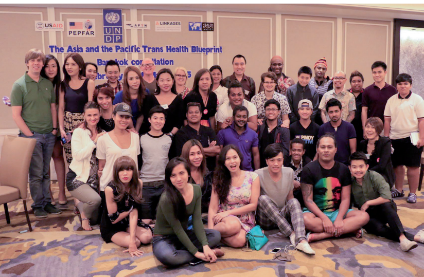
亚太跨性别健康蓝图The Asia and the Pacific Trans Health Blueprint Bangkok Consultation, 2015.