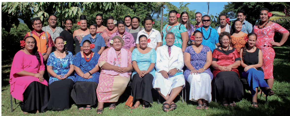
萨摩亚酷儿协会 Samoa Fa'afafine Association, 2018