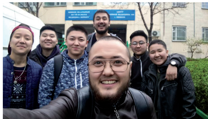
来自吉尔吉斯斯坦的跨性别活动家在TDOV当天与其他健康从业人员交谈。

虽然使用了我们积累的知识和研究以及在线资源的证据，但是我们的研究只是冰山一角：我们希望社群、学者和社会公正活动家们能够使用、补充、挑战和建立在这里所呈现的信息。