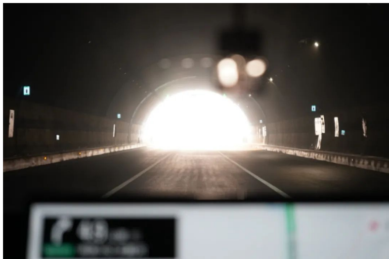
回县城老家时路过隧道

反复询问后，我才明白她想表达的准确意思，是想拥有一个理解她、陪伴她、关爱她的人，至于性别，无关男女。