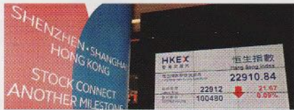
財經焦點 22 深滬股票市場互聯互通 「深港通」最快12月底有得炒