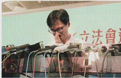
港聞焦點 14 立法會選戰結束 多位新人入議事堂