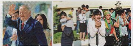
國際焦點 36 烏茲別克強人 卡里莫夫病逝