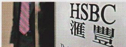
財經要聞 28 滙控再回購 逾216萬股