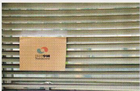
窗上掛着「環跨中國」的標誌。