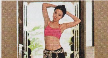
華人生活圈 34 美華裔「辣媽」 變身時尚教主