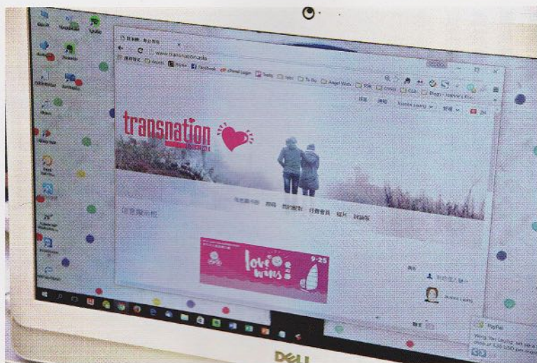
「跨樂園」平台 (transnation) 的網頁界面。