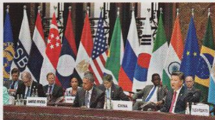
兩岸焦點 30 杭州G20峰會 經濟外的文化盛宴