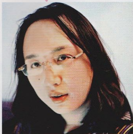
唐鳳確定接任台灣「行政院政務委員」。

以德州為首的11州對此提出集體訴訟，打算推翻「指南」，並指控聯邦政府試圖利用「行政手段」改寫法律，他們並痛批這項政策是「一場大規模的社會實驗」。德州檢察總長派克斯頓曾向記者表示，如有必要將一路奮戰到最高法院。