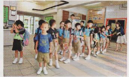
港澳要聞 20 學額尚欠1.4萬個 入小一爭崩頭