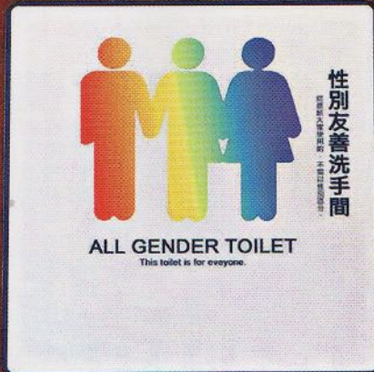
「性別友善洗手間」添加了「第三性」圖案。