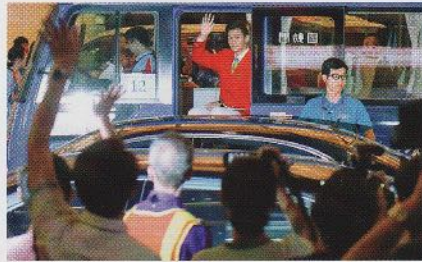
港澳焦點 17 精英運動員訪港澳 全城瘋狂