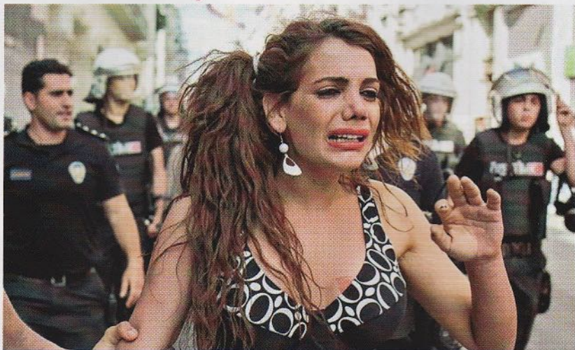
卡迪爾生前參與爭取LGBT權益的政治活動時被警方逮捕。(網上圖片)