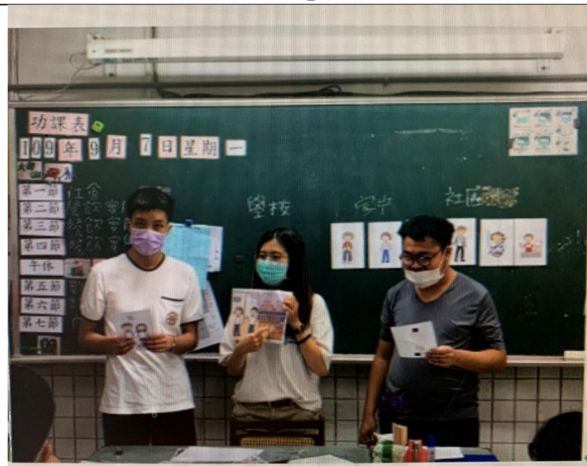
「玩遊戲，學性平」實際上課情形3