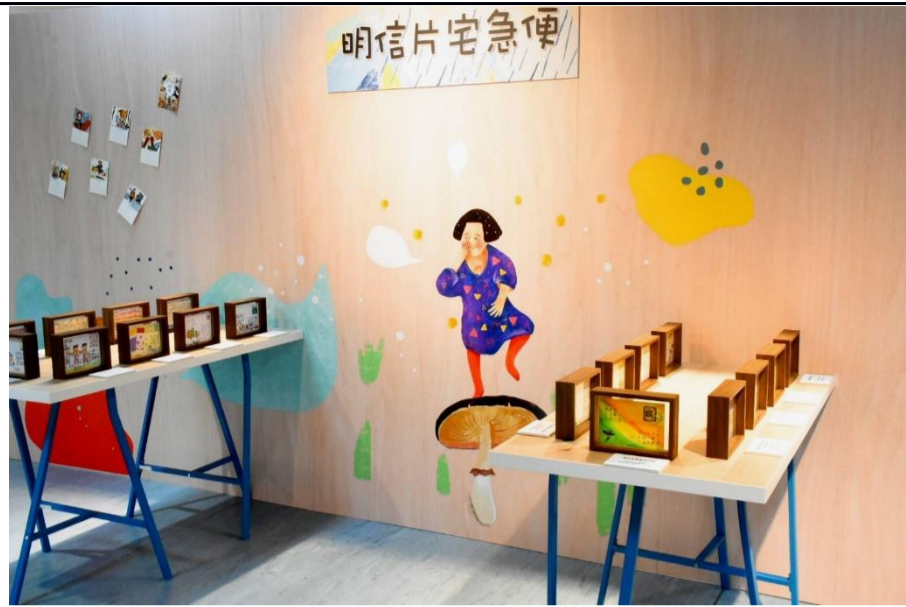
展場3-得獎明信片展示區