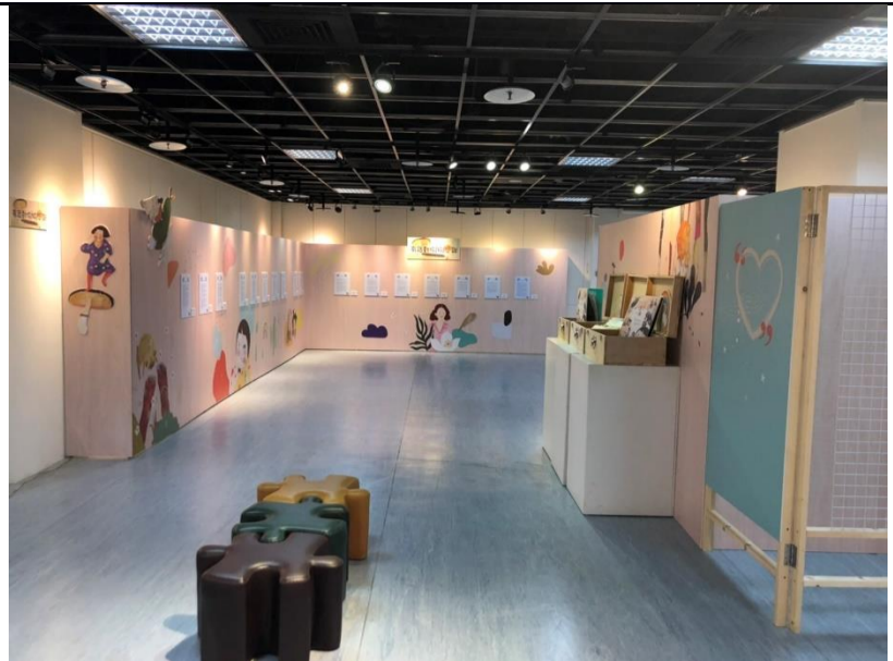
展場4-得獎小書展示區