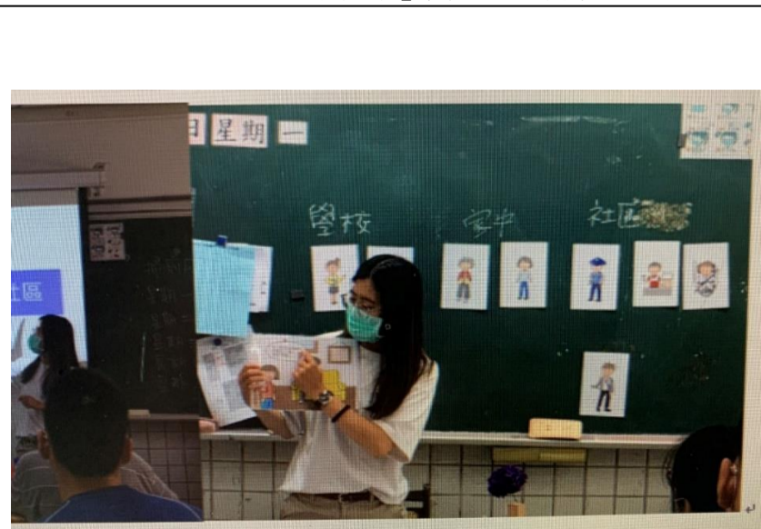
「玩遊戲，學性平」實際上課情形4