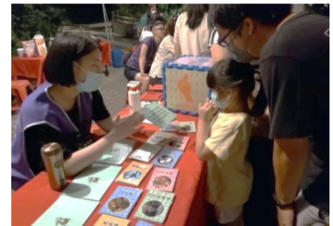
▲教育部世界地球日系列活動 (9月16日辦理)