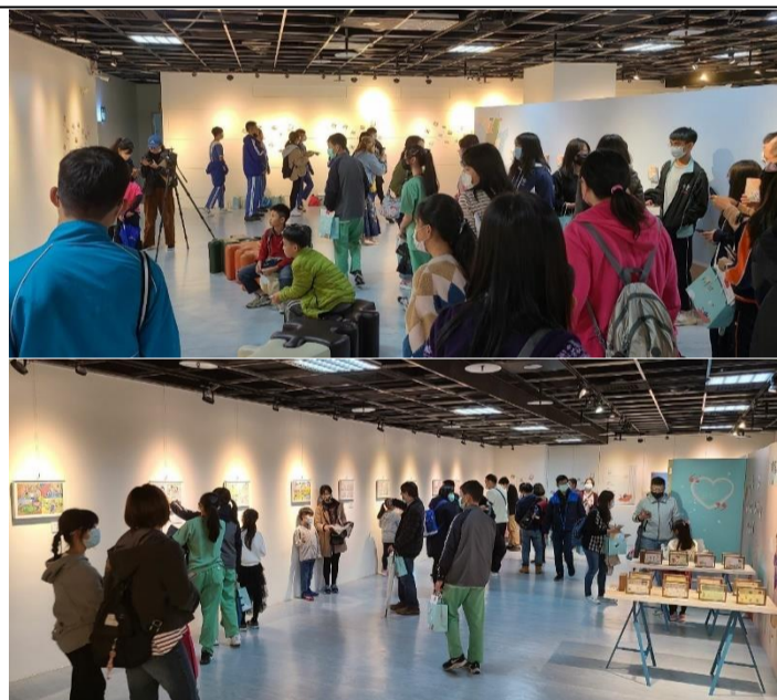
長安國小3年及作品-有點不一樣男孩