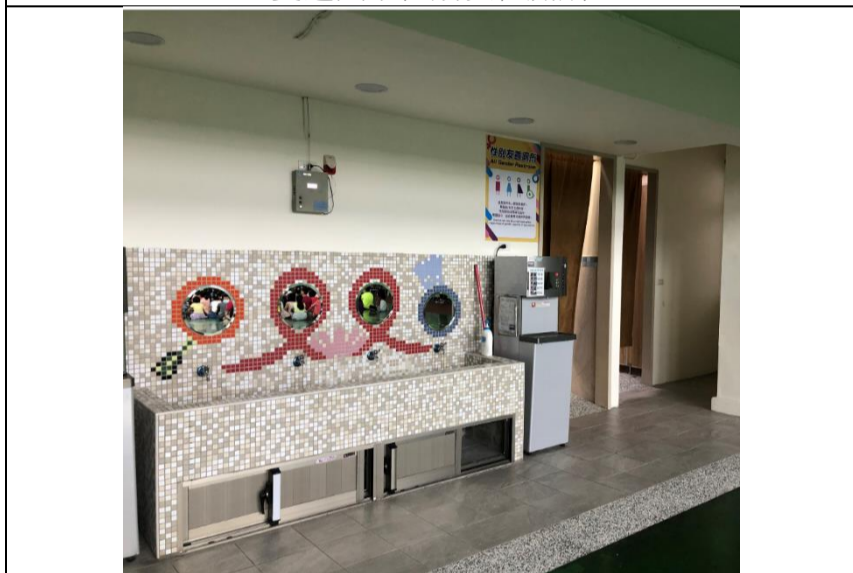
雙蓮國小性別友善廁所

109年增建性別友善廁所之學校包括：蘭雅國中、建國中學、萬芳國小及雙蓮國小等4所學校。