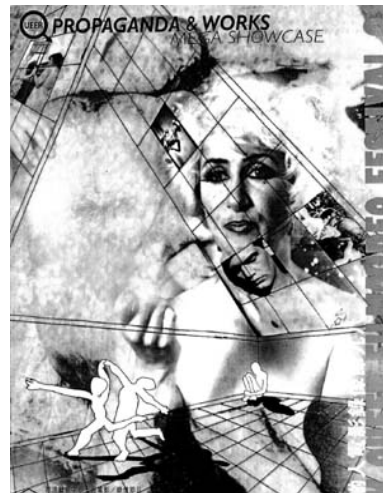
林奕華策劃的最後一次同志影展的海報 (1998 年)

表面上，同志都是喜歡與自己同性別的人，事實上，同志族群中，也存在著很大的差異性，歐美以 LGBT、LGBTQ、LGBTQI、LGBTQQ 等方式來代稱同志族群，每一個字母都代表一種同志身份的類別，而這裡則是採用臺灣青少年性別文教會[3]主張的 LGBTSQQ 來介紹同志族群。LGBTSQQ 各是代表哪 7 個同志身份呢？分別是女同性戀 (Lesbian)、男同性戀 (Gay)、雙性戀 (Bisexual)、跨性別 (Transgender)、直同志 (Tonzhi-friendly Straight, 對同志社群友善的，並願意成為同志社群一員的異性戀)、酷兒 (Queer, 泛指受異性戀霸權的性體制所壓迫的性與性別邊緣的，且接納自己與別人的差異的人)、疑性戀 (Questioning, 質疑或不確定性別/情慾固定認同的人) 身份的同志，這裡的定義，不以標準化的工具來判定一個人是否為同志，而以個人自我認同自己是同志的一份子，就是同志，也就是說，我們無法從任何測驗、口頭問答、行為標準來知道一個人是否為同志，而強調個人認同同志身份、同志族群，進一步自我認同為同志。