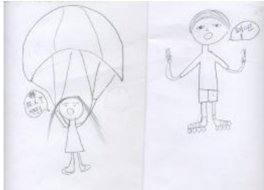
圖 7 國中一年級男生畫女孩和男孩 (no.106f7)

在問題的部份，問題一「你覺得他/或她是個什麼樣的男孩/女孩？(個性…)」的回答被分為二類，一為「積極正面」，另一為「消極負面」。