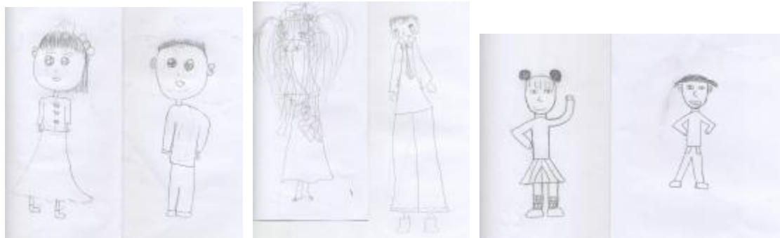
圖 1 國小三年級女生畫

最後，每一位受調學生所畫男女生的圖像，先被分為兩個類別：一為「有區別」，另一為「沒有區別」。有「區別」者再細分為四類：一、為「衣服」（如圖一至七），二、為「髮型」（如圖一至七），三、「配件」（如耳環、項鍊、腰帶、帽子等）（如圖二、四、五及六）、和四、「動作或活動」（如運動、工作等）（如圖三、四、五、六及七）。